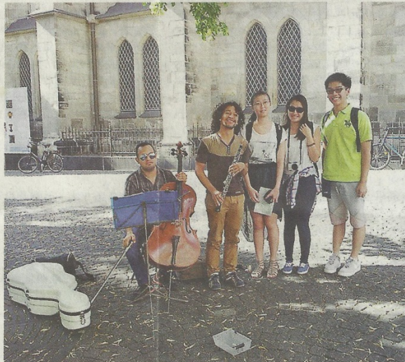
沙田崇真中學 3 名學生(右一至三)，憑努力贏取免費德國遊，到當地探索音樂文化。校方邀請他們今日在開學禮上分享經歷，勉勵學生為夢想奮鬥。(網上圖片)

有什麼可能成功，但他們仍嘗試，怎知之後主辦單位又說他們的計劃書太難執行，要求重寫，同學當時很失望，以為一定失敗。」但該 3 名學生明白，不堅持便注定失敗，於是互相鼓勵，重寫計劃書，最終勝出，獲頒 10 萬元與一名教師共赴德國，探索